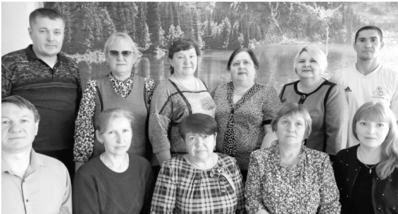
Коллектив школы села Озёрки поздравляет с наступающим праздником педагогов района

Первая школа в селе Озёрки была открыта в 1903-1904 годах. Она была трёхклассной, состояла из одной классной комнаты, в которой было всего несколько парт. До революции в школе обучалось очень мало детей. Трёхклассное учебное заведение просуществовало до 1932-1933 годов. Затем была построена новая четырёхклассная школа, по окончании которой дети шли в пятый класс в село Челно-Вершины. Только в 1940-1941 годах в селе Озёрки открыли пятый класс. Здание школы было не типовое, а построенное из старых жилых домов. Оно было ветхое, холодное. В коридоре и в каждом классе находилась печь. Занятия проходили в две смены. И только в 1951-1952 годах здание было капитально отремонтировано, и в школе открылось ещё два класса. Строение находилось около оврага, в центре Озёрок, в окружении зелёных насаждений и считалось достопримечательностью села. В 1961-1962 годах Озёрская семилетняя школа реорганизована в восьмилетнюю. В январе 1970 года на краю села около сельского клуба была построена новая школа из кирпича. После каникул дети начали учиться в просторных светлых кабинетах, в которых всё сверкало краской и было очень уютно. И так, 11 января 1970 года началась работа в новой добротной восьмилетней школе.